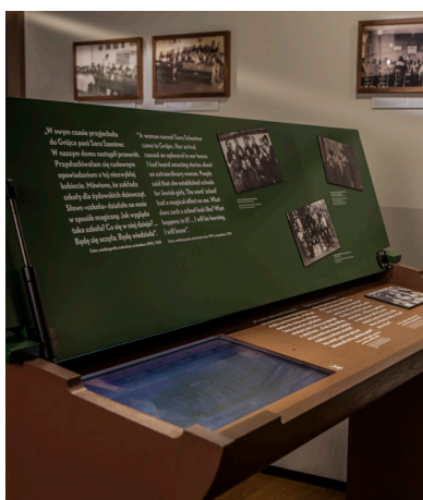
Ławka prezentująca szkoły religijne

Z ulicy skręć w trzecie drzwi na prawo. Zobaczysz tu zdjęcie kobiet podczas kampanii wyborczej. W pomieszczeniu po drugiej stronie znajduje się ściana z prasą – w części polskojęzycznej odszukaj tygodnik „Ewa”.