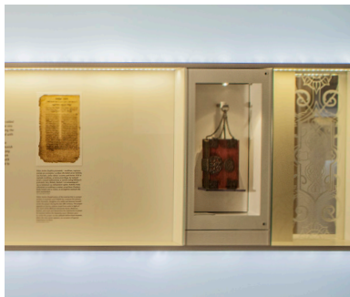
Gablota prezentująca modlitewnik